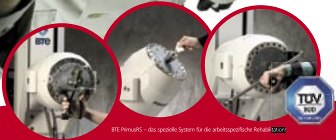
BTE PrimusRS – das spezielle System für die arbeitsspezifische Rehabilitation!