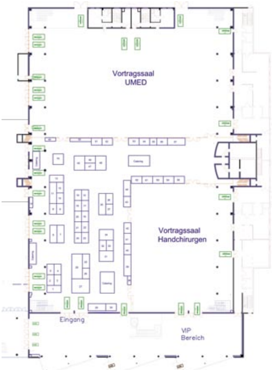
48. Kongress der Deutschen Gesellschaft für Handchirurgie gemeinsam mit der Unfallmedizinischen Tagung des LVBG Nordostdeutschland Estrel Convention Center Berlin, 04.-06. Oktober 2007